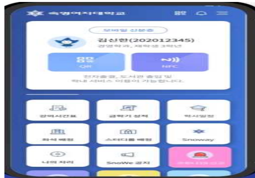
헤이영(APP) 숙명 모바일 서비스 종합 어플리케이션