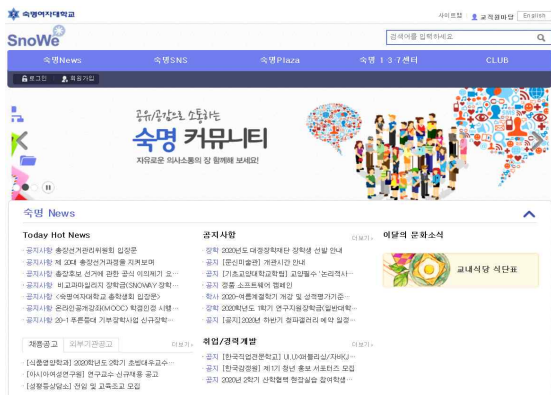
SnoWe(커뮤니티) 각종 공지사항을 확인할 수 있는 곳