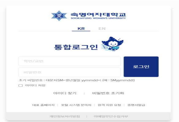
숙명포털시스템 학사 전반에 대한 정보를 제공하는 곳