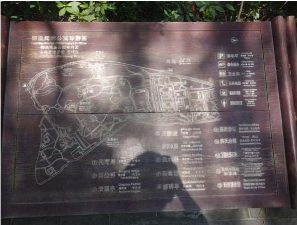
항저우 서호의 초입부