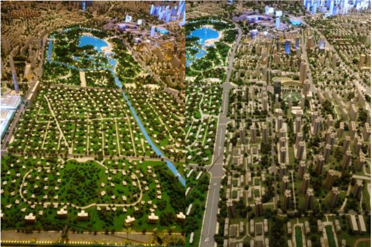
어마어마한 크기의 모델