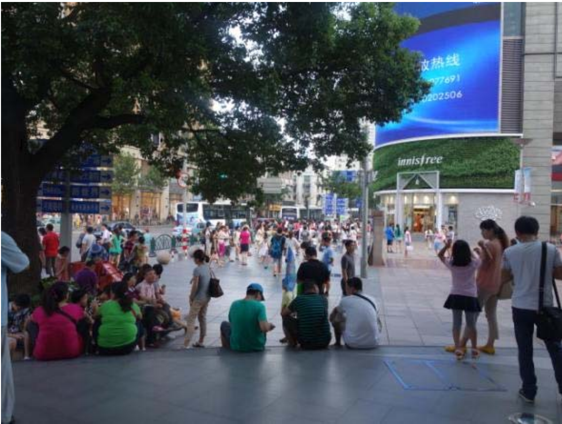
상해의 도심에 해당하는 지역인 난징동루의 초입부로 만남의 장소임