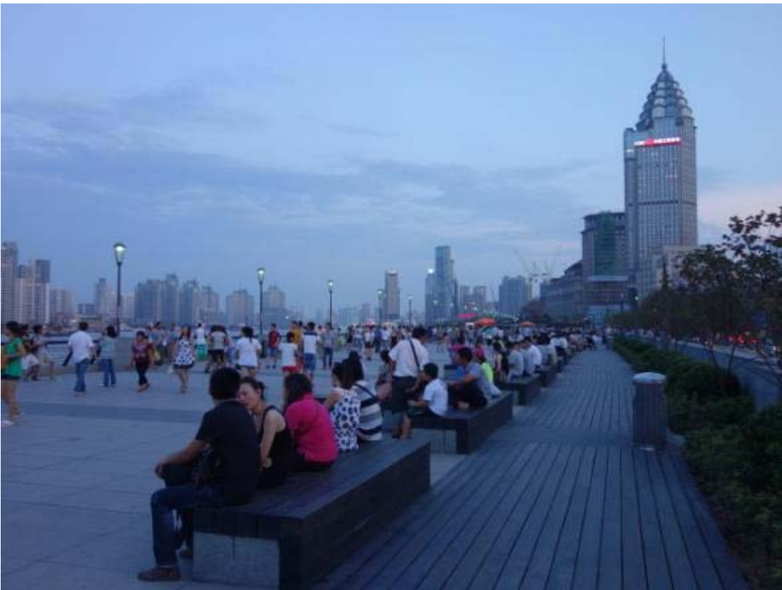
푸서지역 광장은 시민들의 휴식공간이자 관광객들의 관광명소로 자리잡고 있음