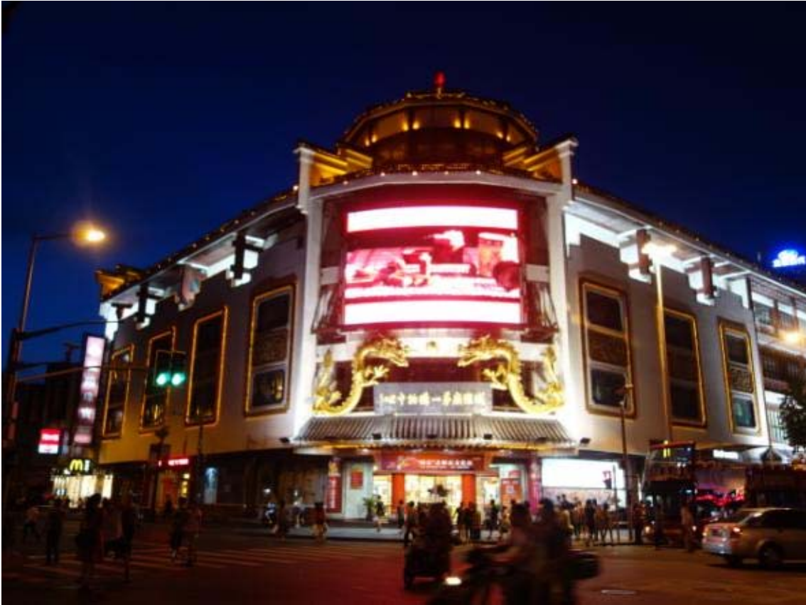
상해에서 들려야 할 명승지 중 하나인 예원