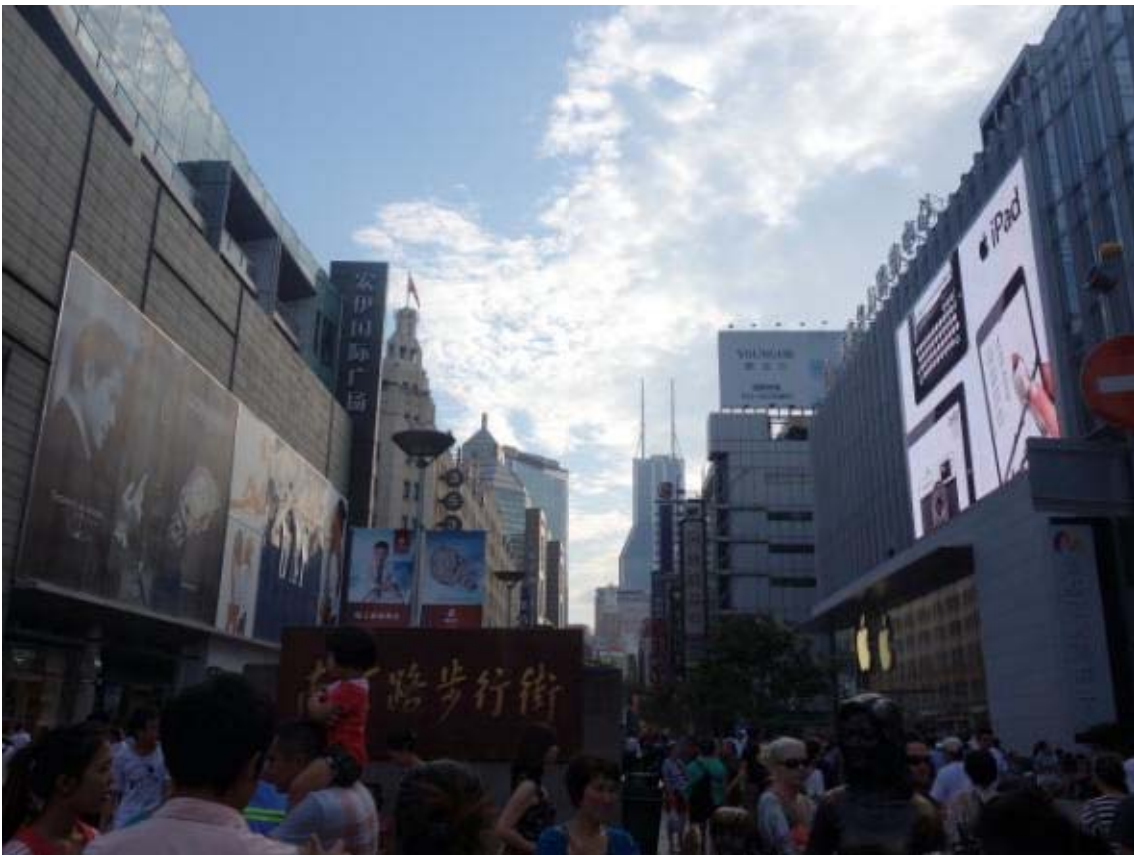
난징동루의 초입부에서 바라본 난징동루의 스카이라인(대체적으로 고른 스카이라인을 보임)