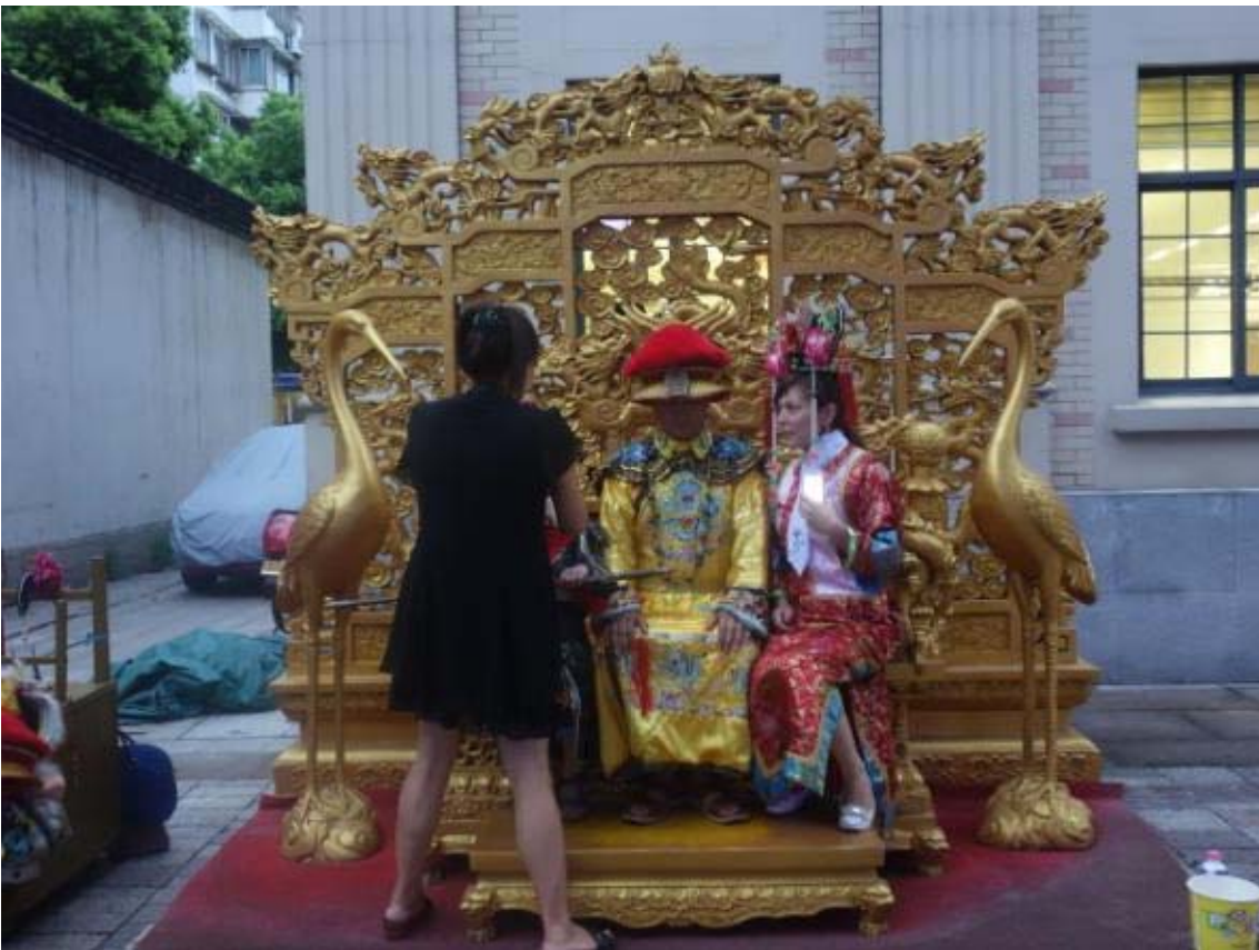
중국 전통의상을 입고 사진을 찍어주는 거리의 노점