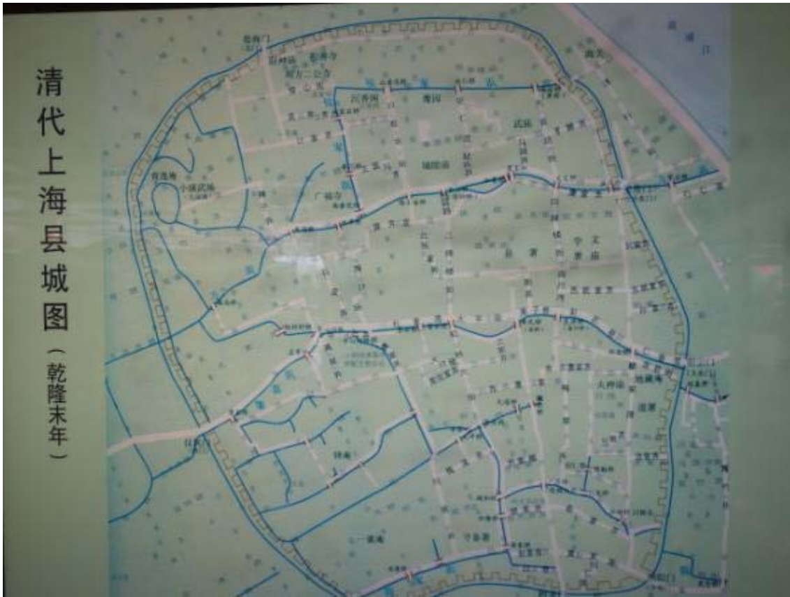
상해 도시계획 도면