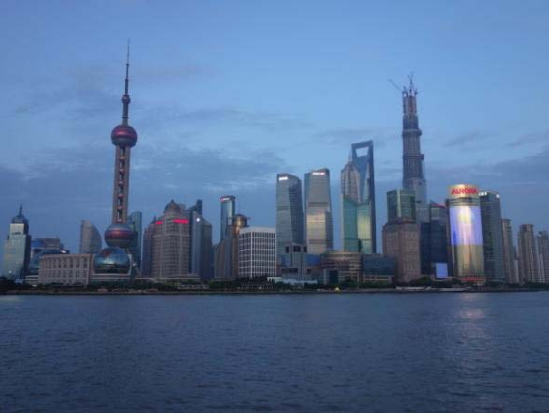
푸서지역에서 바라본 푸동지역