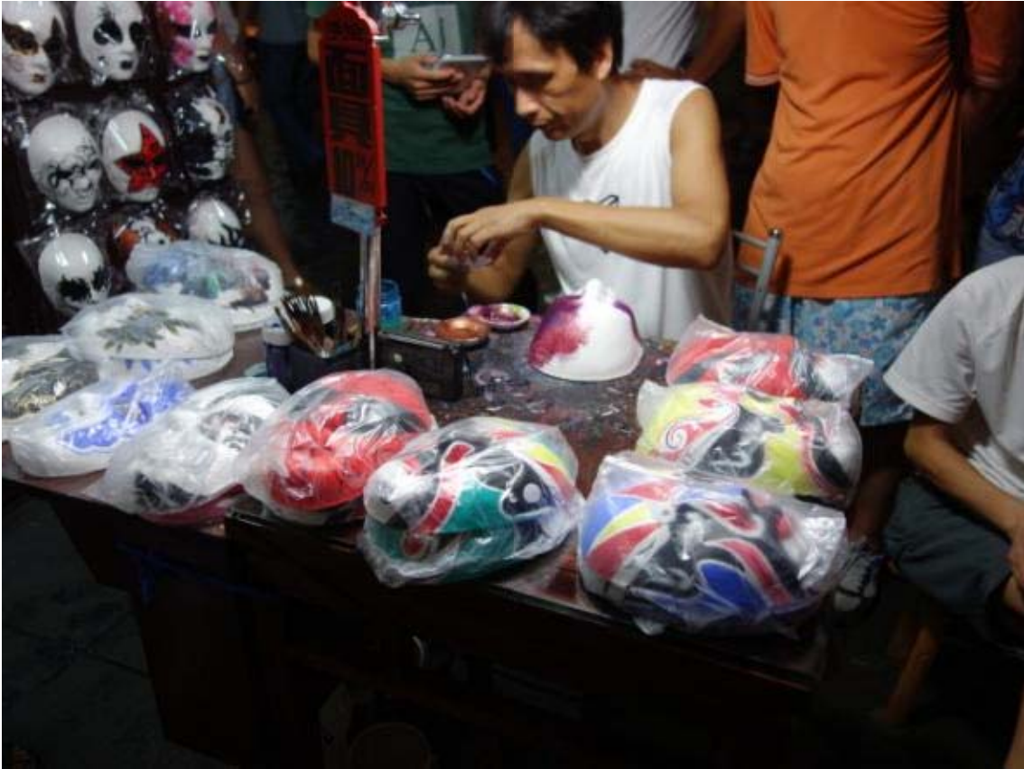
수공예 가면 제작