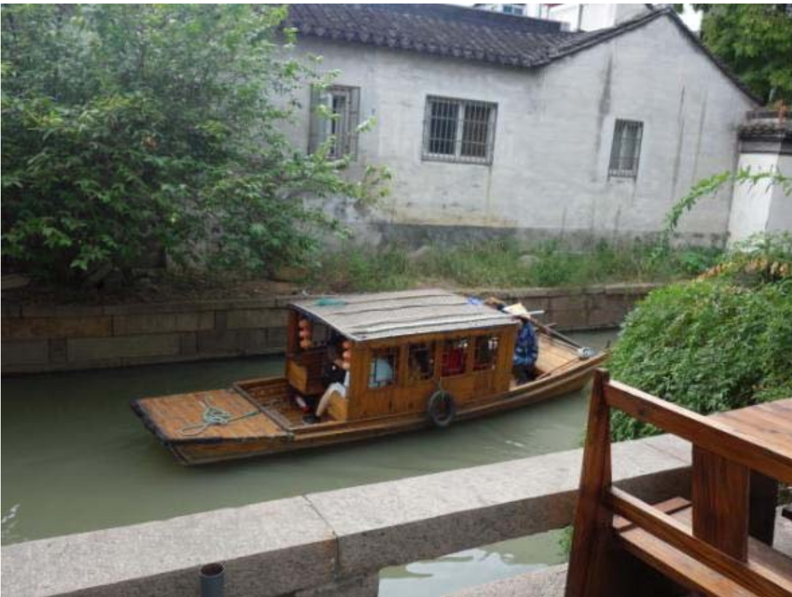
관광객들의 필수 코스인 나룻배 타기