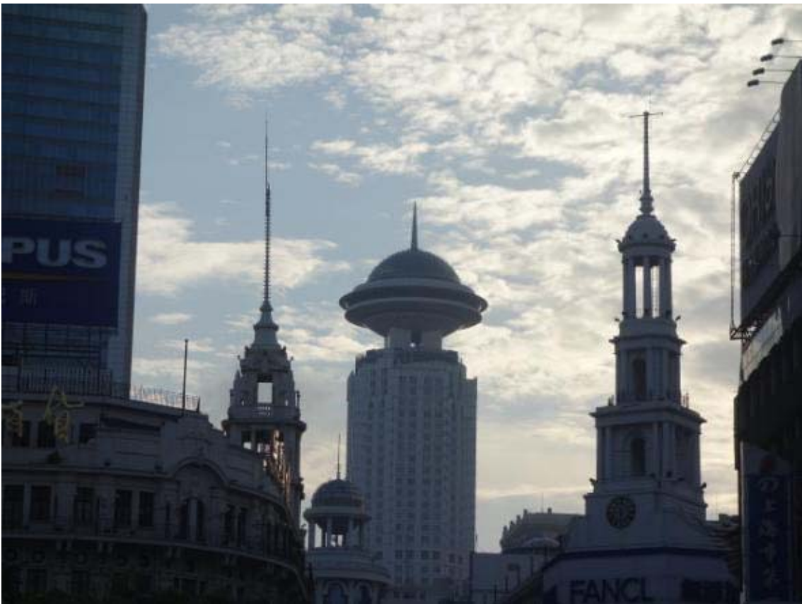
난징동루의 다양한 형태의 고층건물들