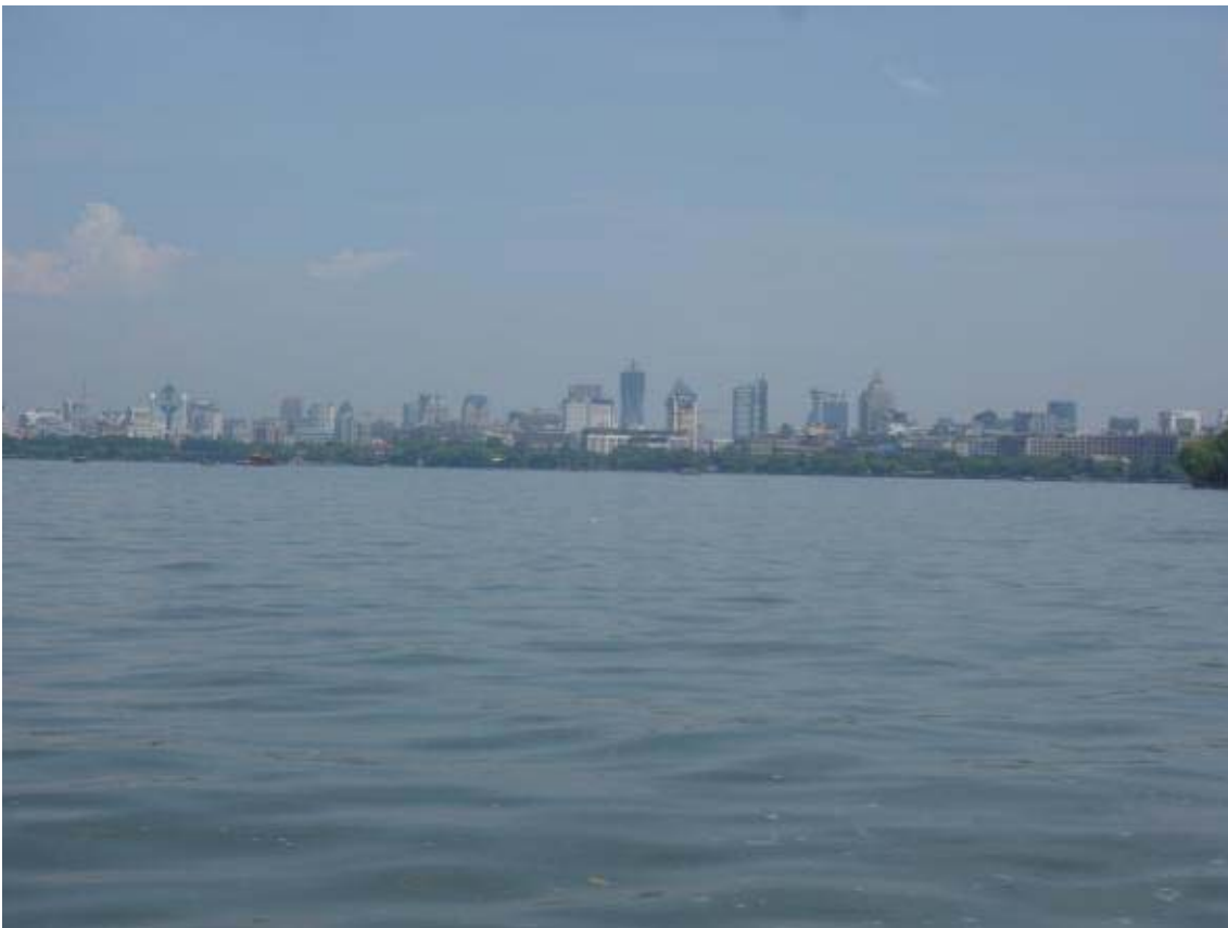
서호에서 바라본 항저우의 도심지 모습(도심의 현대식건물과 서호의 역사가 깃든 건물이 조화를 이룸)