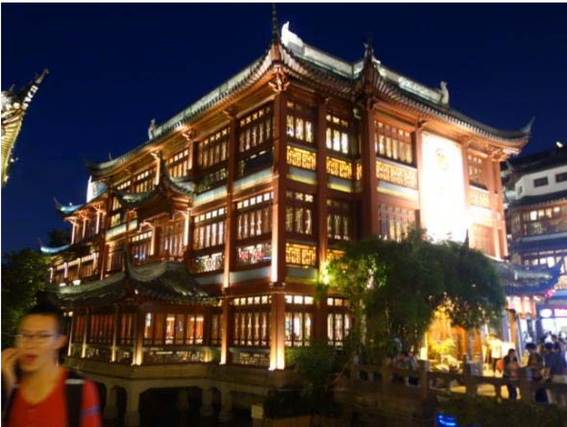
화려한 야경을 자랑