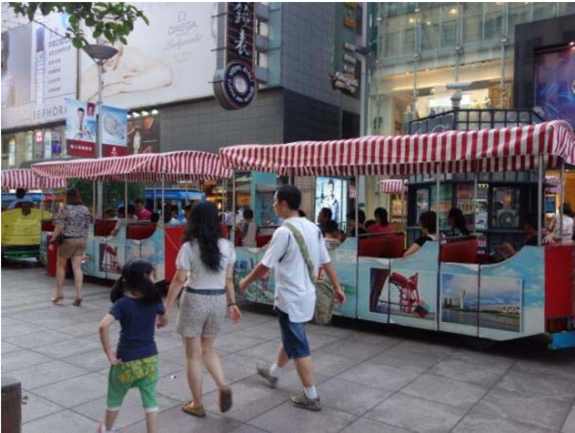
다양한 트램이 존재