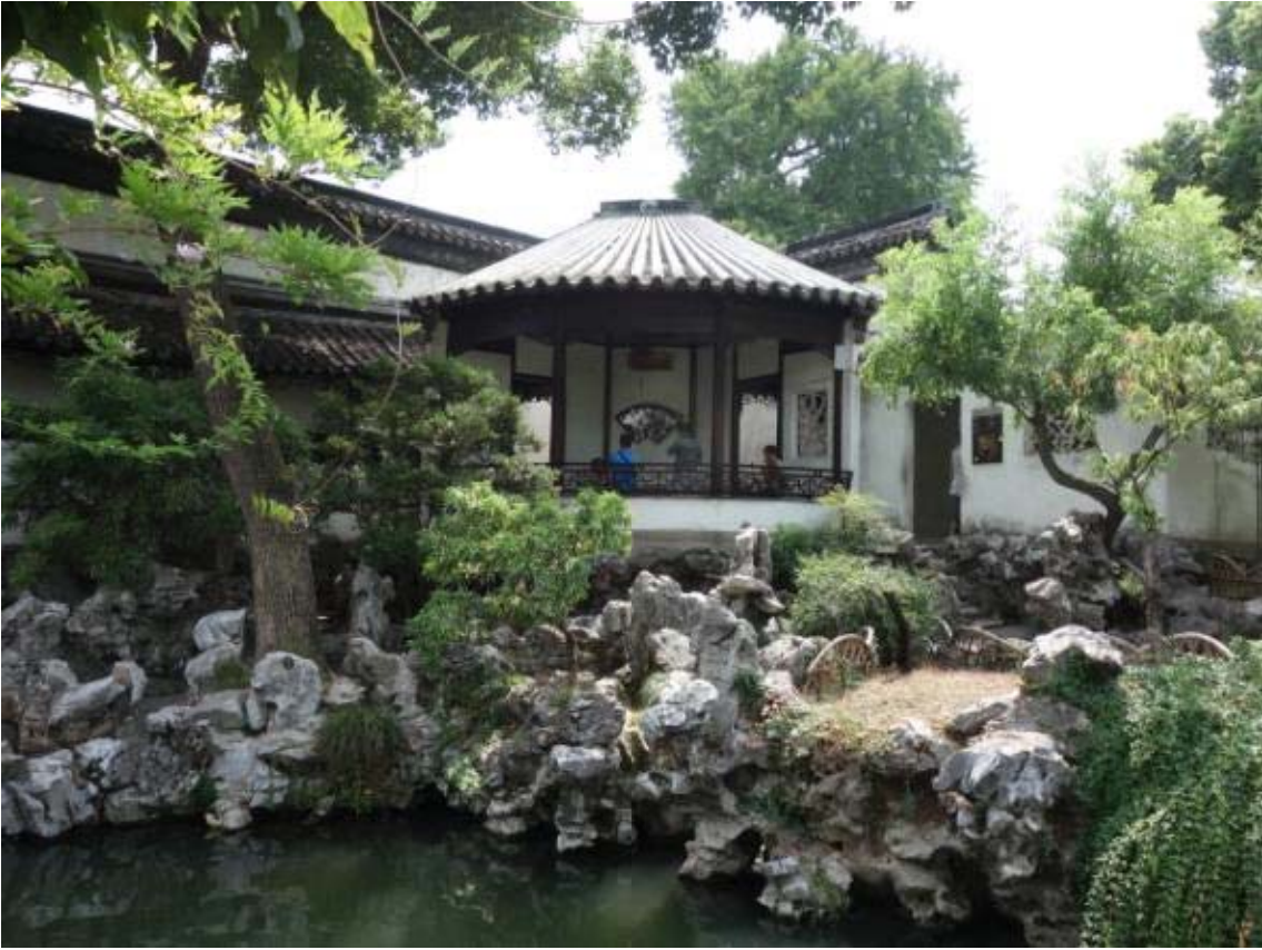
정원 곳곳에 십터가 마련되어 있음