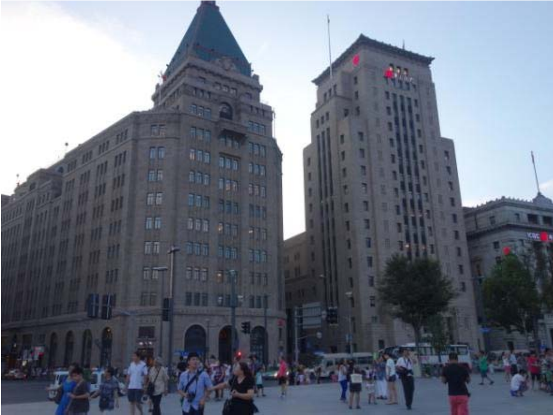
상해의 유명한 거리의 하나로 와이탄으로 불리우며 대형은행들이 모여들면서 고층빌딩이 들어섰다. 150년 전 조계시대에 세워진 다양한 유럽식 건축물이 들어서 있음