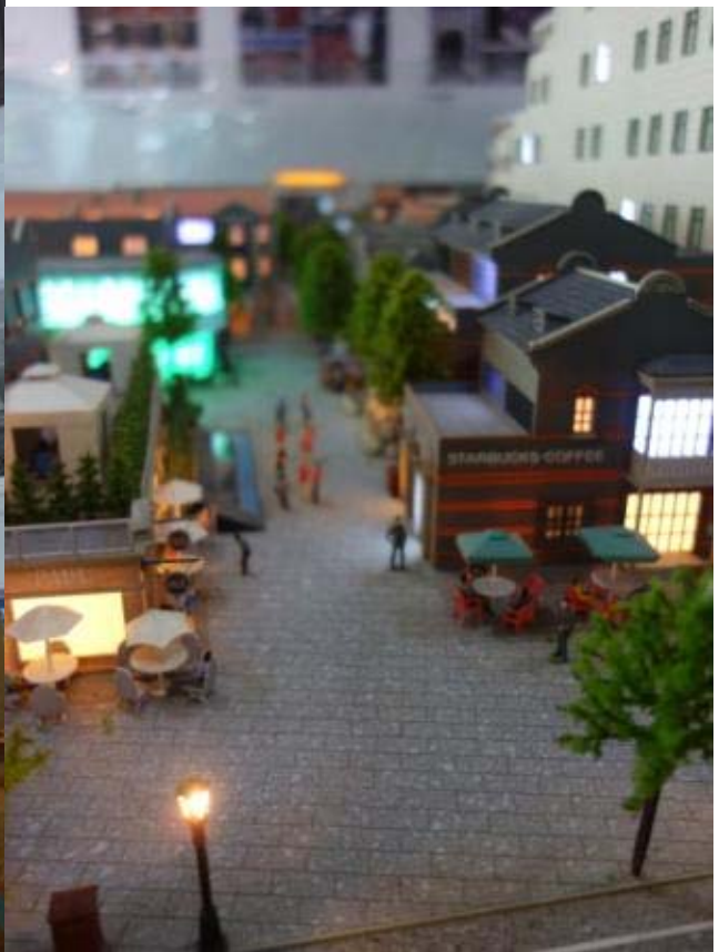
상해 도시계획박물관 상징모형