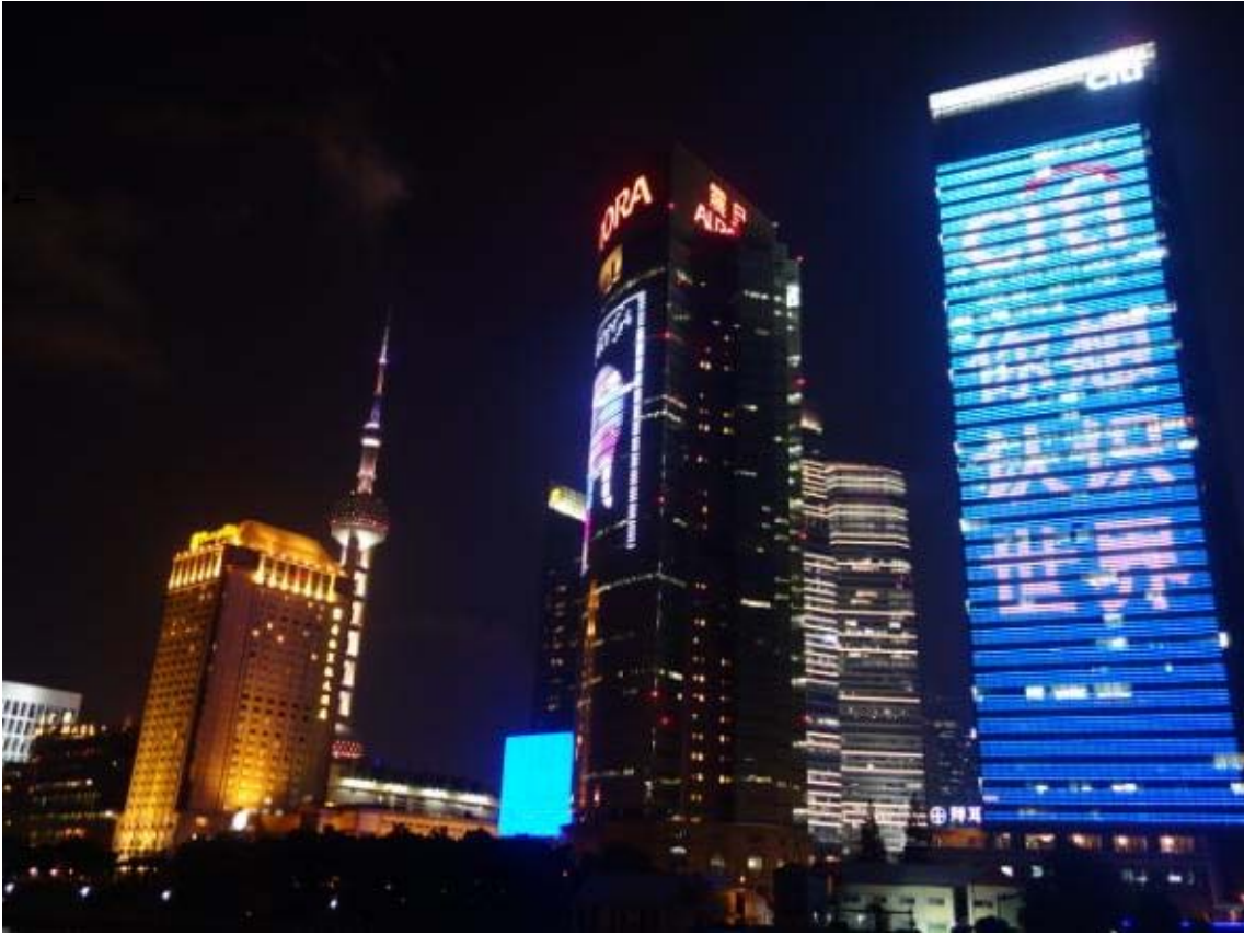
푸서지역에서 바라본 푸동 야경