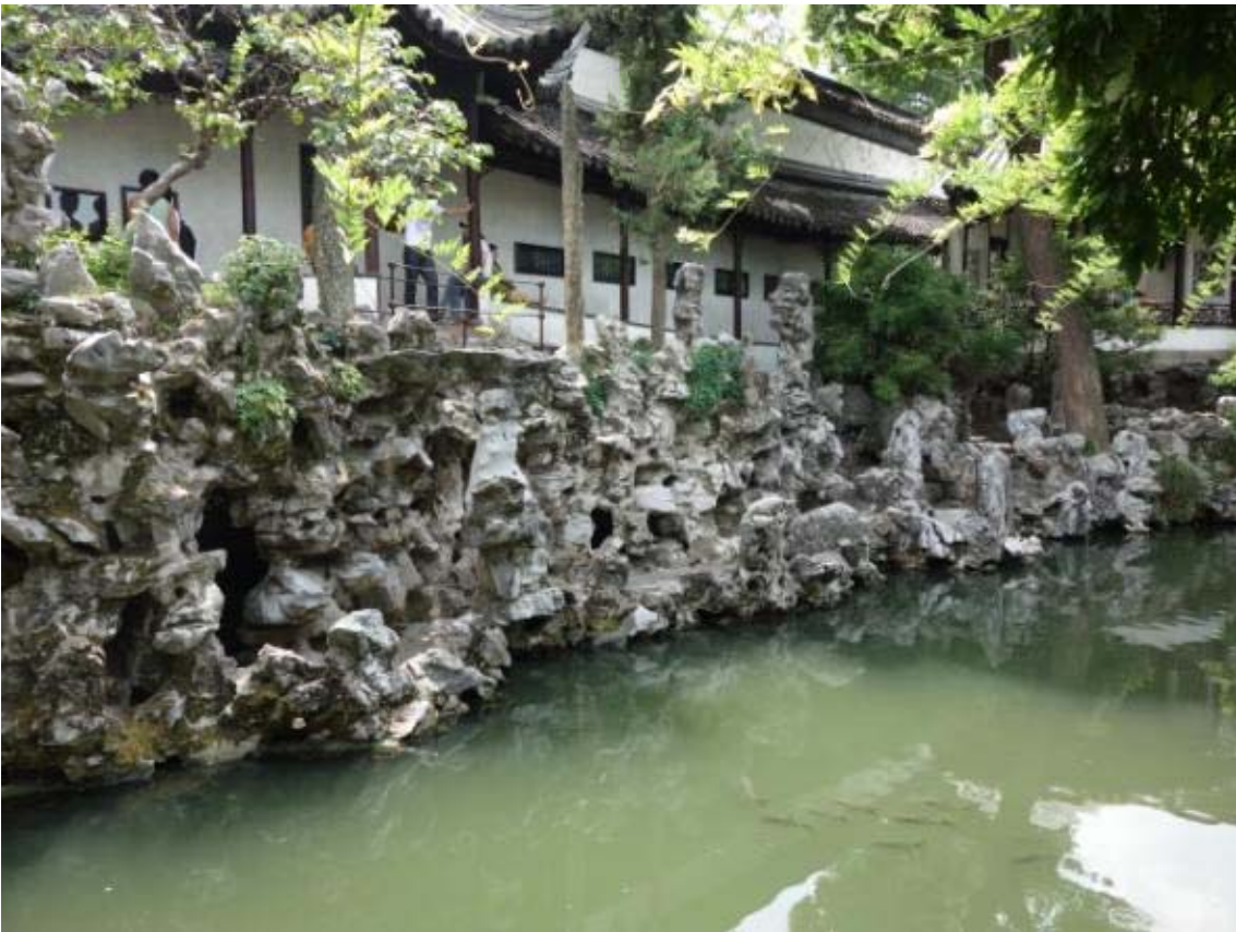
돌무더기가 사자의 모양을 닮았다고 하여 사자림이라 불림