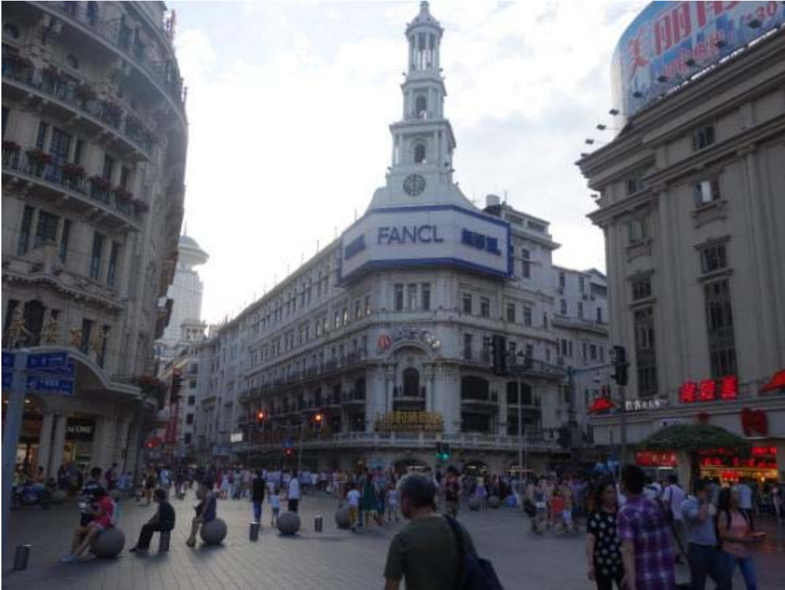
난징동루의 인기쇼핑몰 중 하나로 자리잡고 있는 일본 쇼핑몰 FANCL