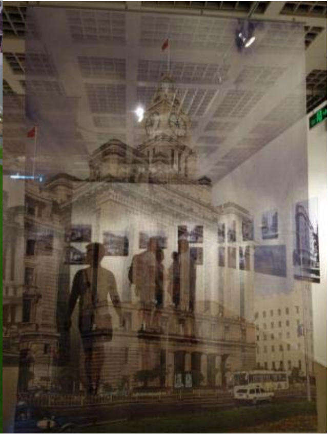
와이탄의 거리를 모형으로 재현