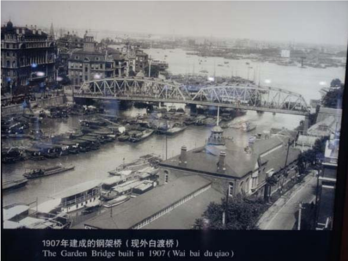
1907年建成的钢架桥（现外白渡桥） The Garden Bridge built in 1907 (Wai bai du qiao)