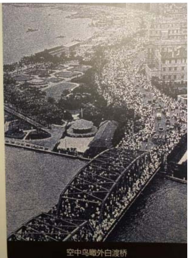
空中鸟瞰外白渡桥