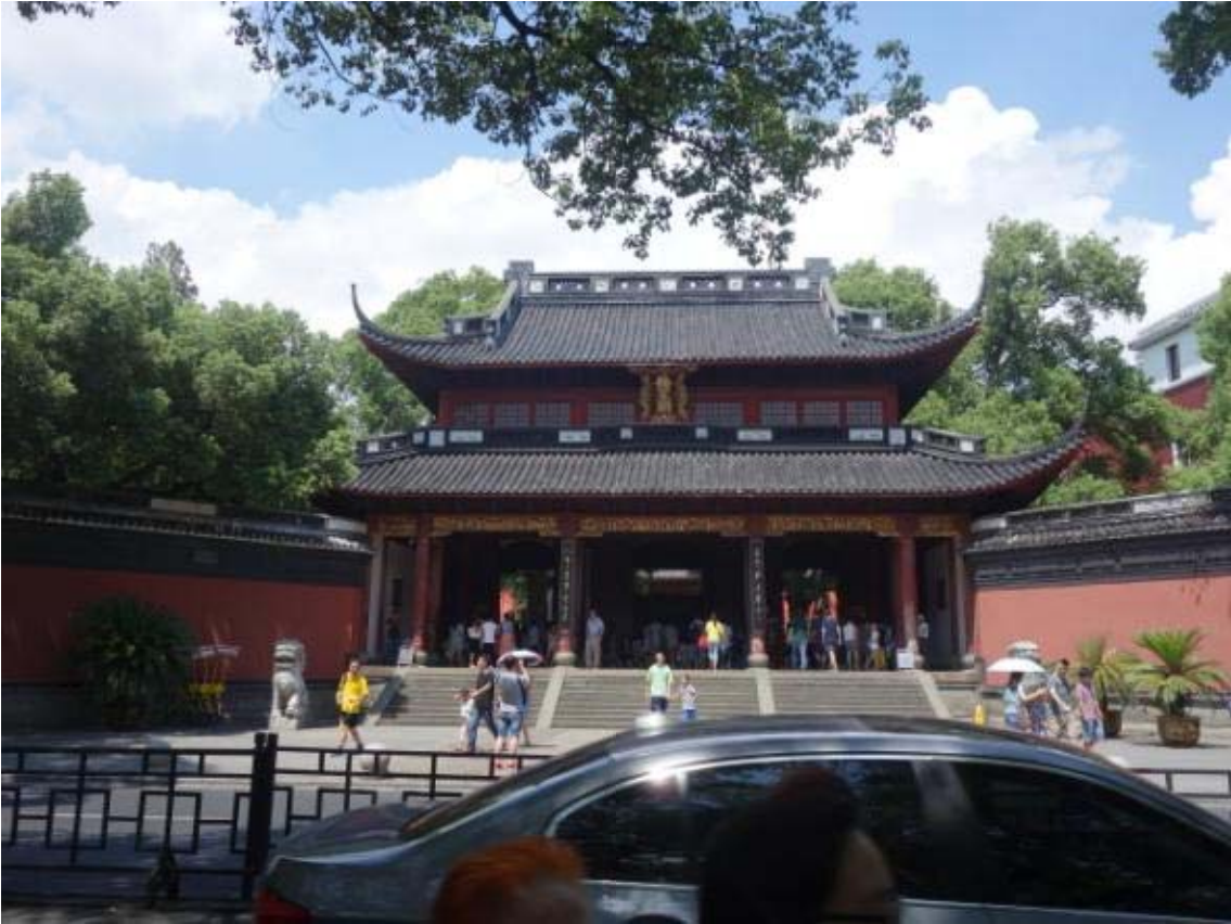
서호의 명승지 중 하나인 악왕의 묘