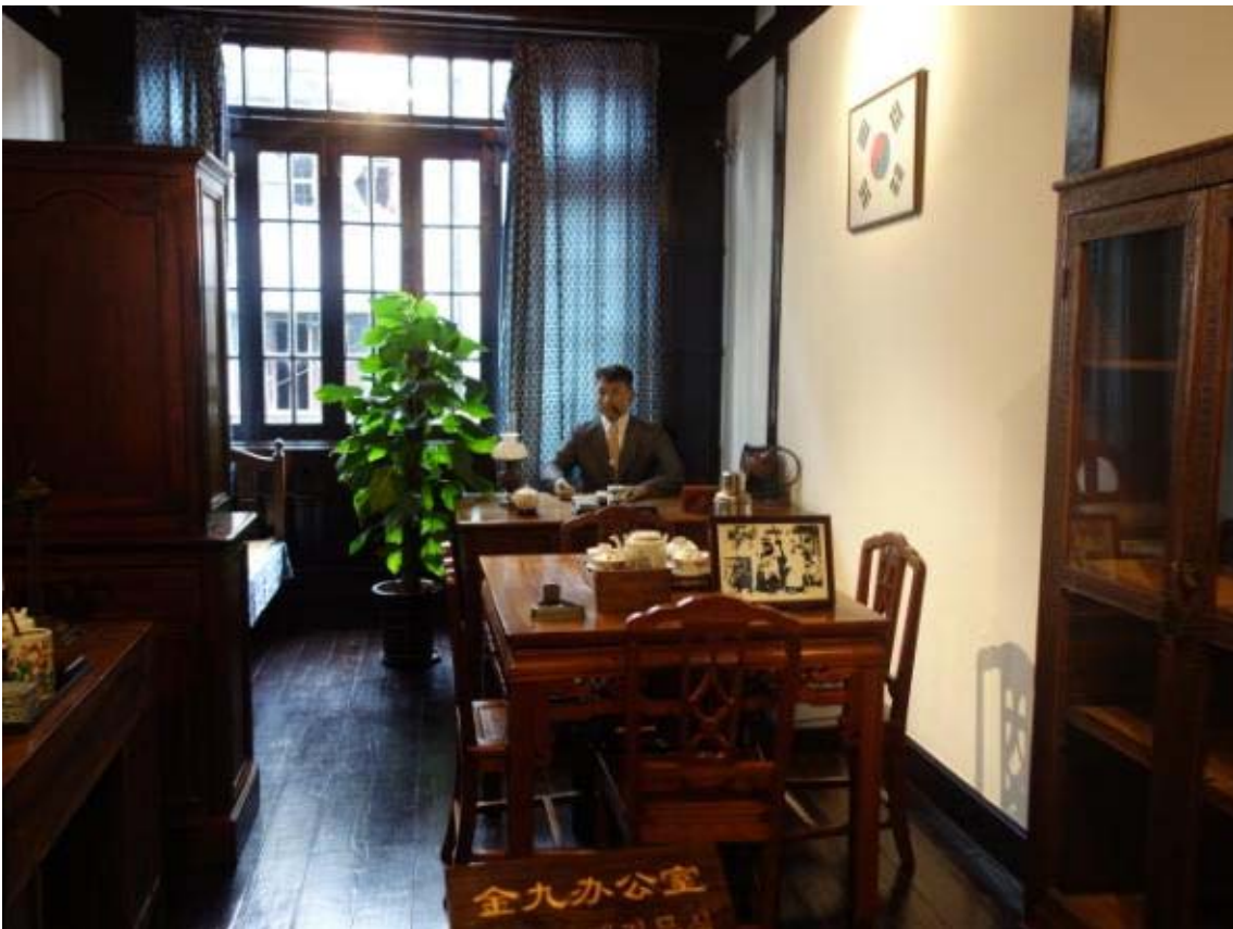
상해 임시정부 박물관