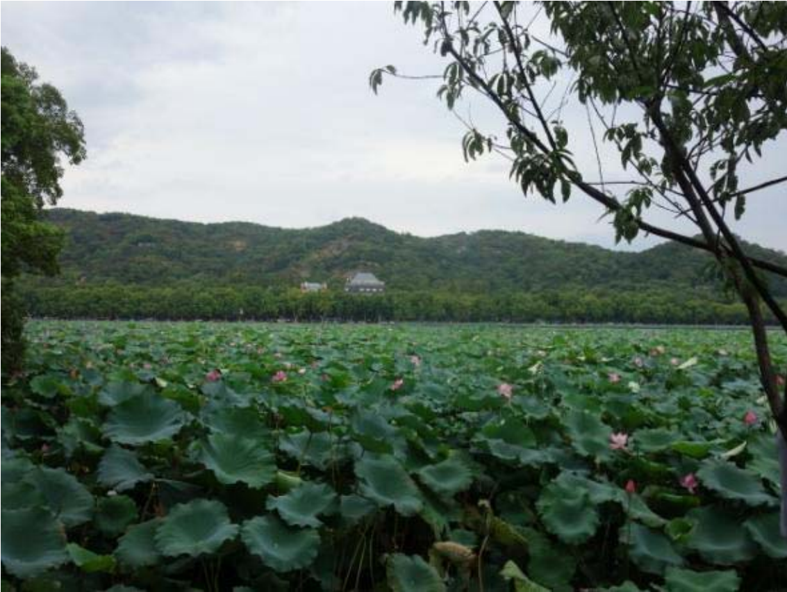
서호에는 어마어마한 규모의 연밭이 존재함