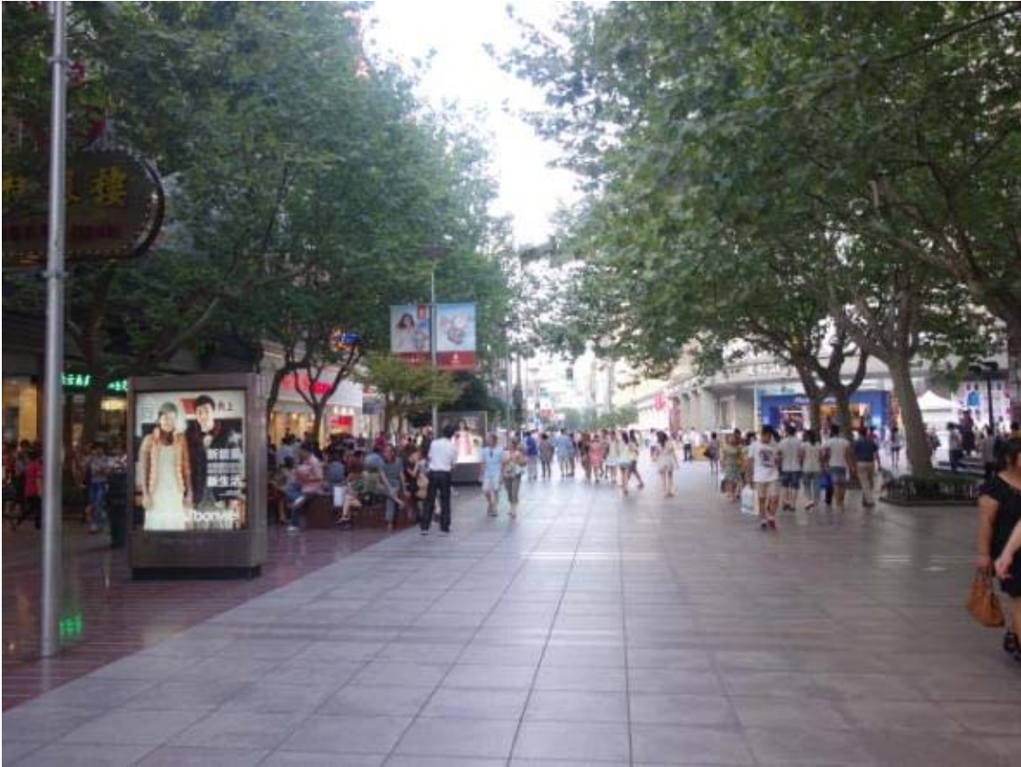
난징동루의 가로(곳곳에 휴식공간이 배치되어 있으며 관광객 및 시민들의 쉼터의 역할을 함)