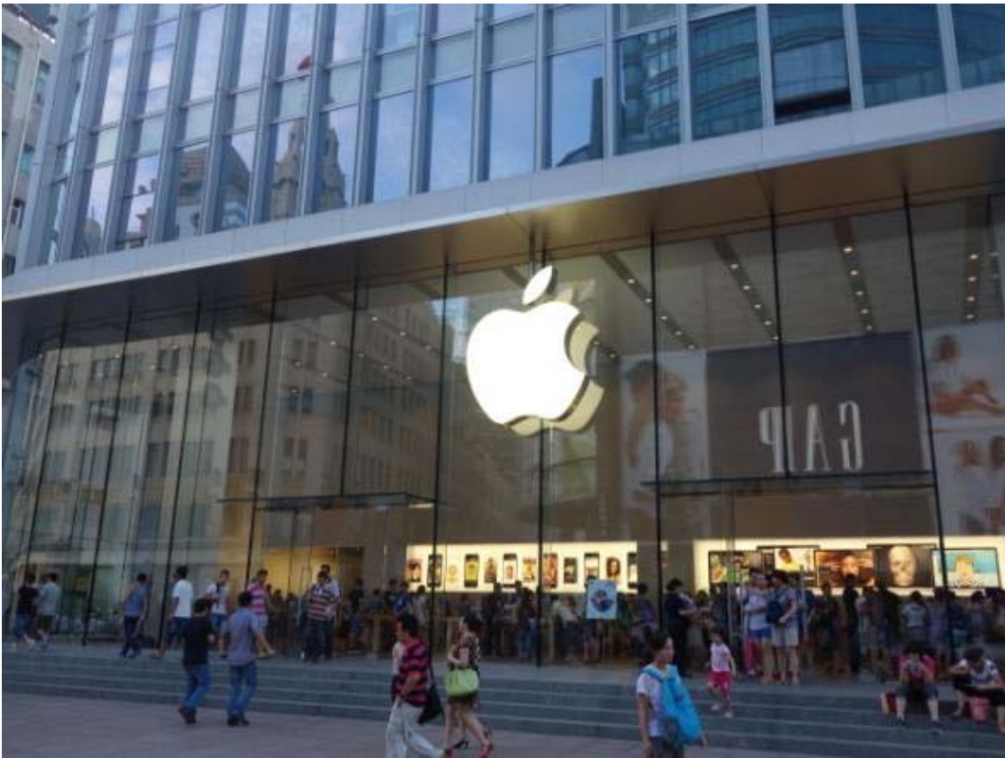
중국의 애플사.. 스케일이 남다름