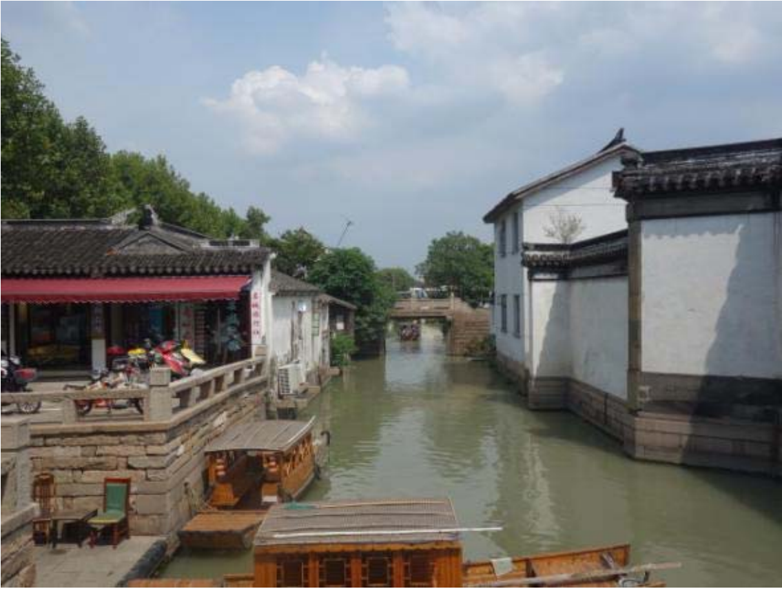
쑤저우(수향마을)의 수로로 배를 타고 도시 전역을 이동할 수 있음