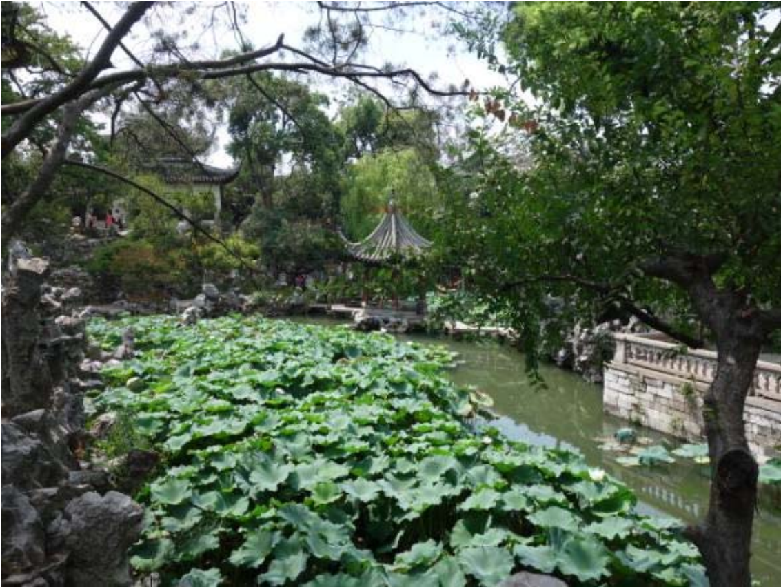
쑤저우의 사자림이라는 곳으로 예원과 비슷한 분위기를 가지고 있으며 조소와 조각이 또 하나의 볼거리를 제공함