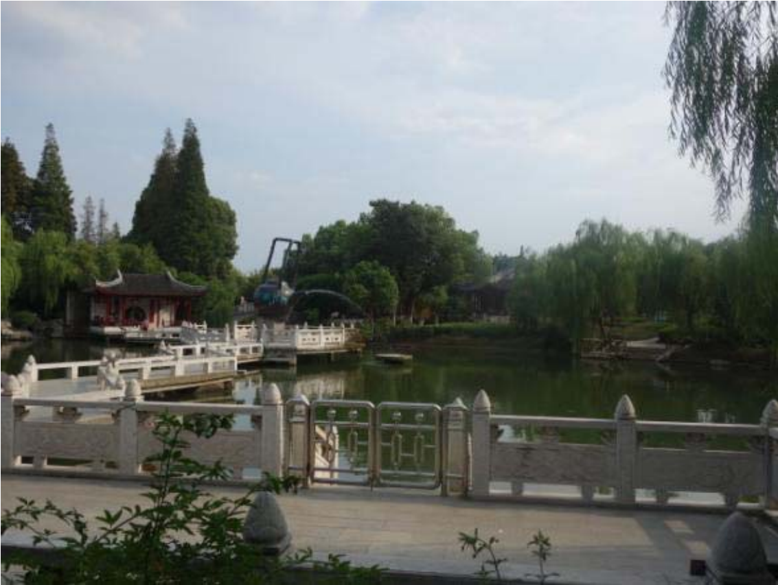
쑤저우의 calm garden? 예원, 사자림과 비슷한 풍경의 정원으로 안정감을 줌