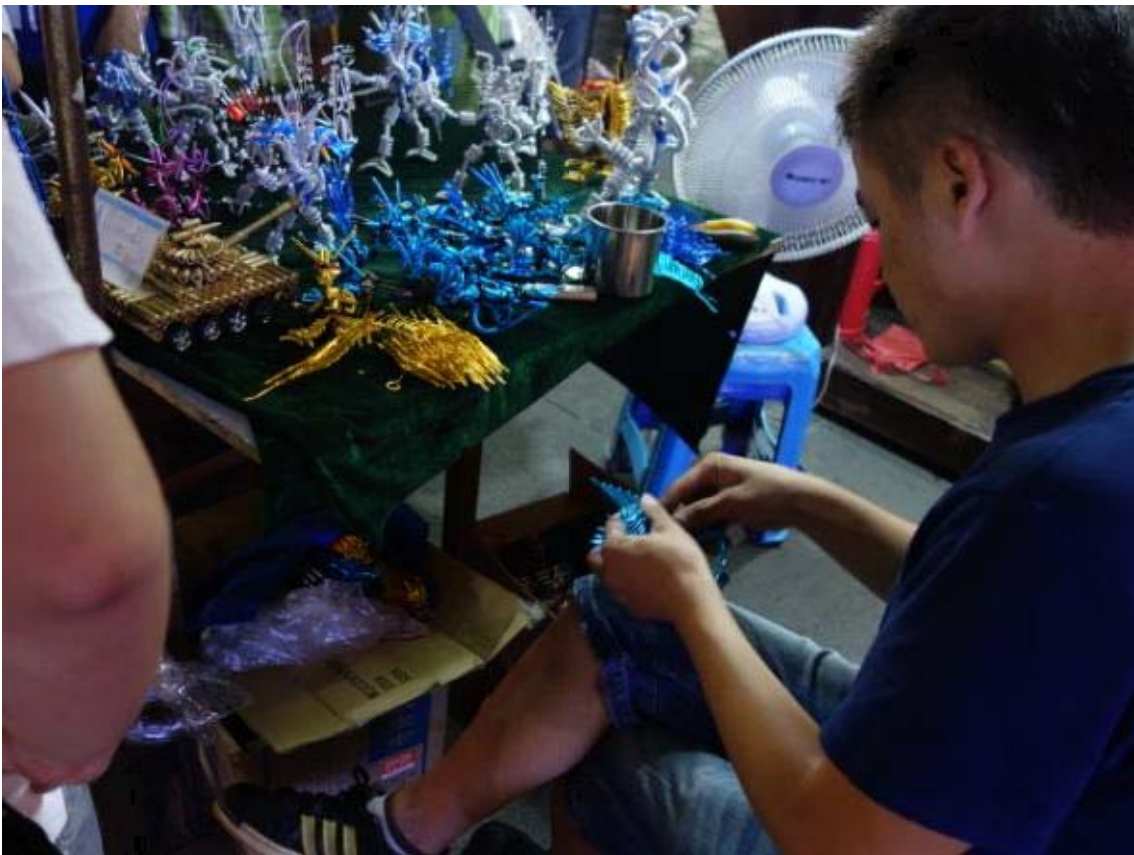
철사를 이용한 장식품을 만드는 상인