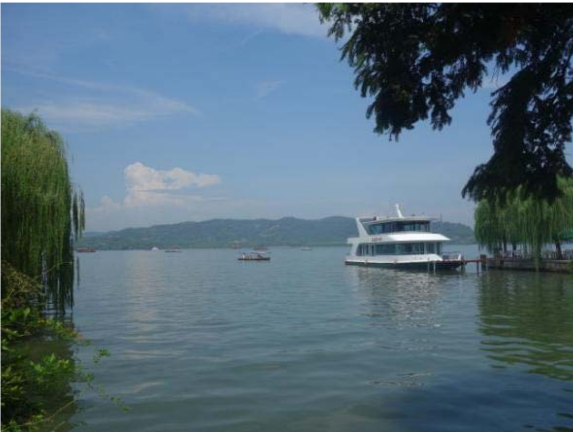
항저우의 서호 풍경