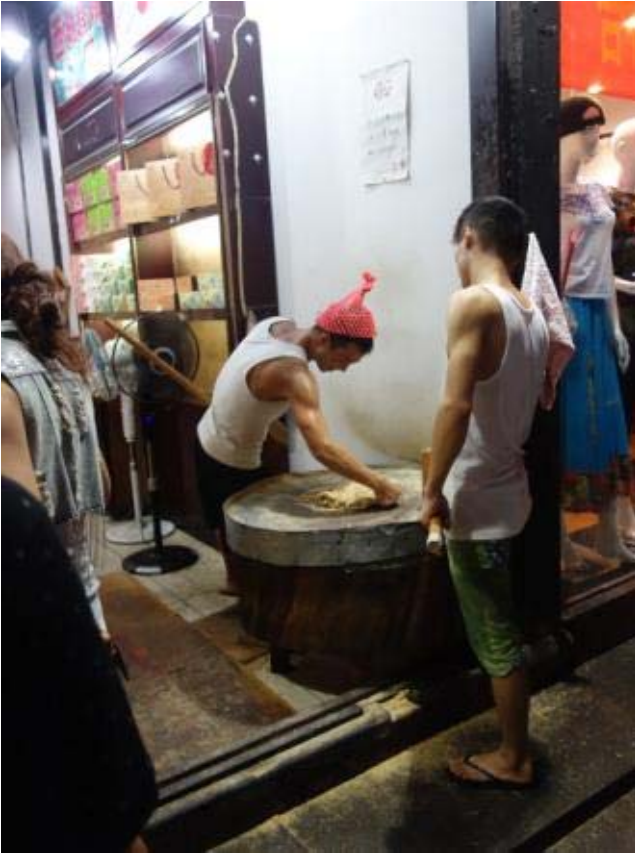
전통 떡을 만드는 사람들