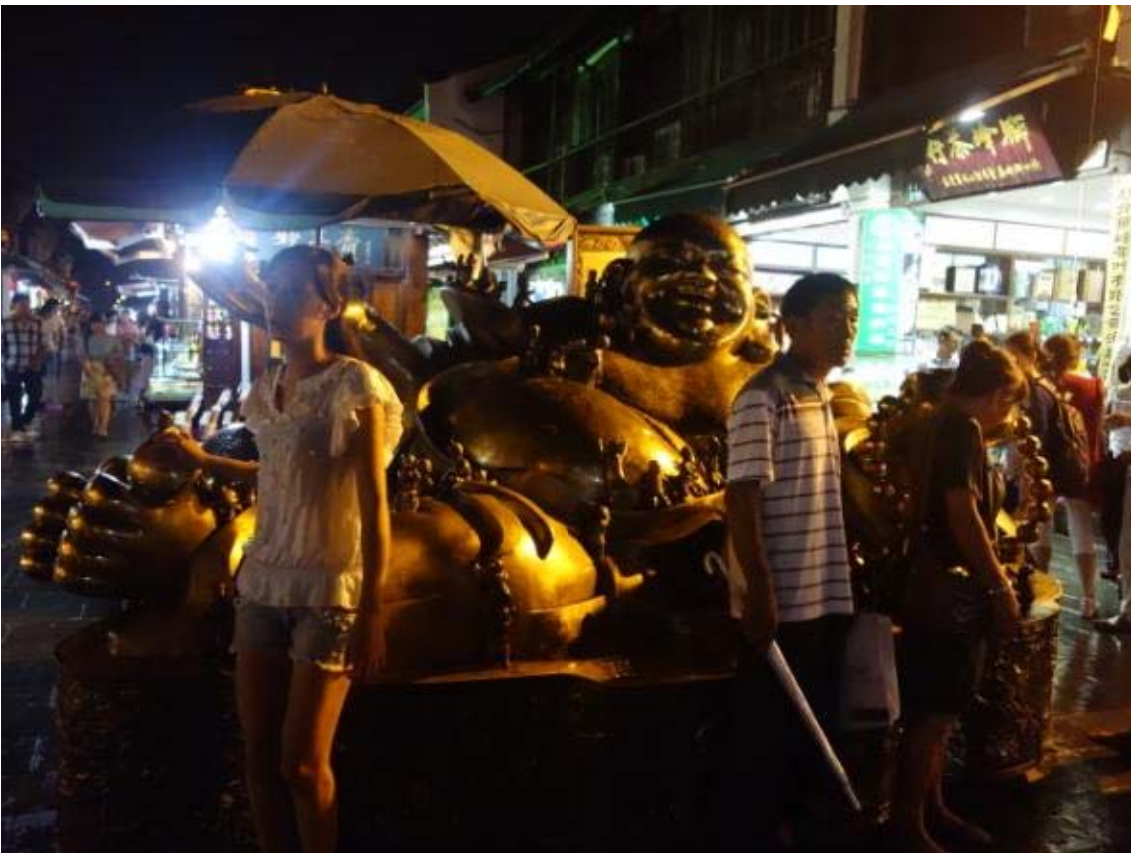
청하방 옛거리를 상징하는 누워있는 금동불상