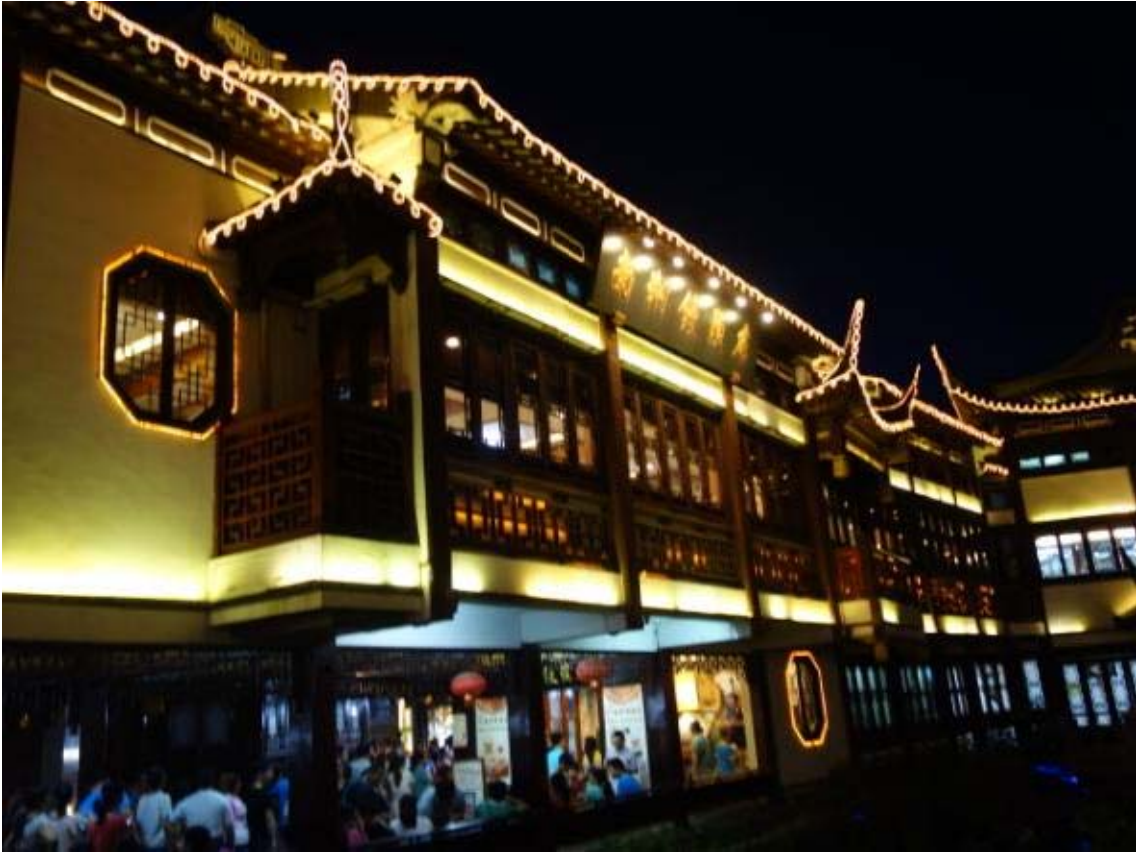
예원에 들리면 꼭 가봐야 할 음식점(샤오롱바오: 만두가 유명함)