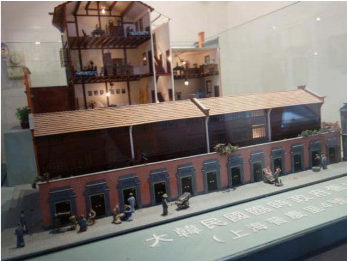
임시정부의 옛 모습 모형