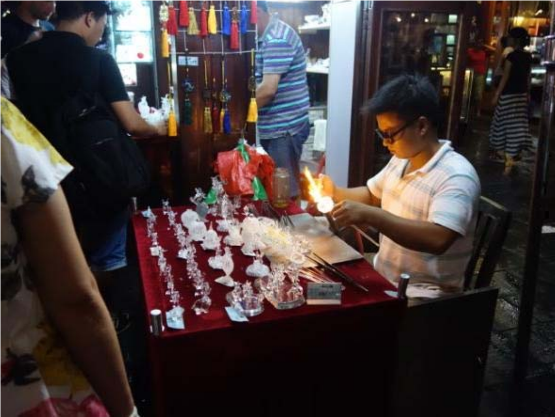
예술가들이 넘쳐나는 청하방 옛거리