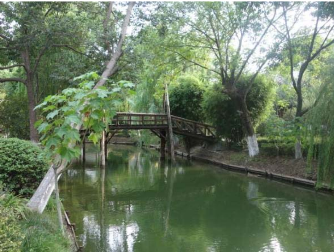
쑤저우의 모든 관광지과 마을은 배를타고 이동이 가능함