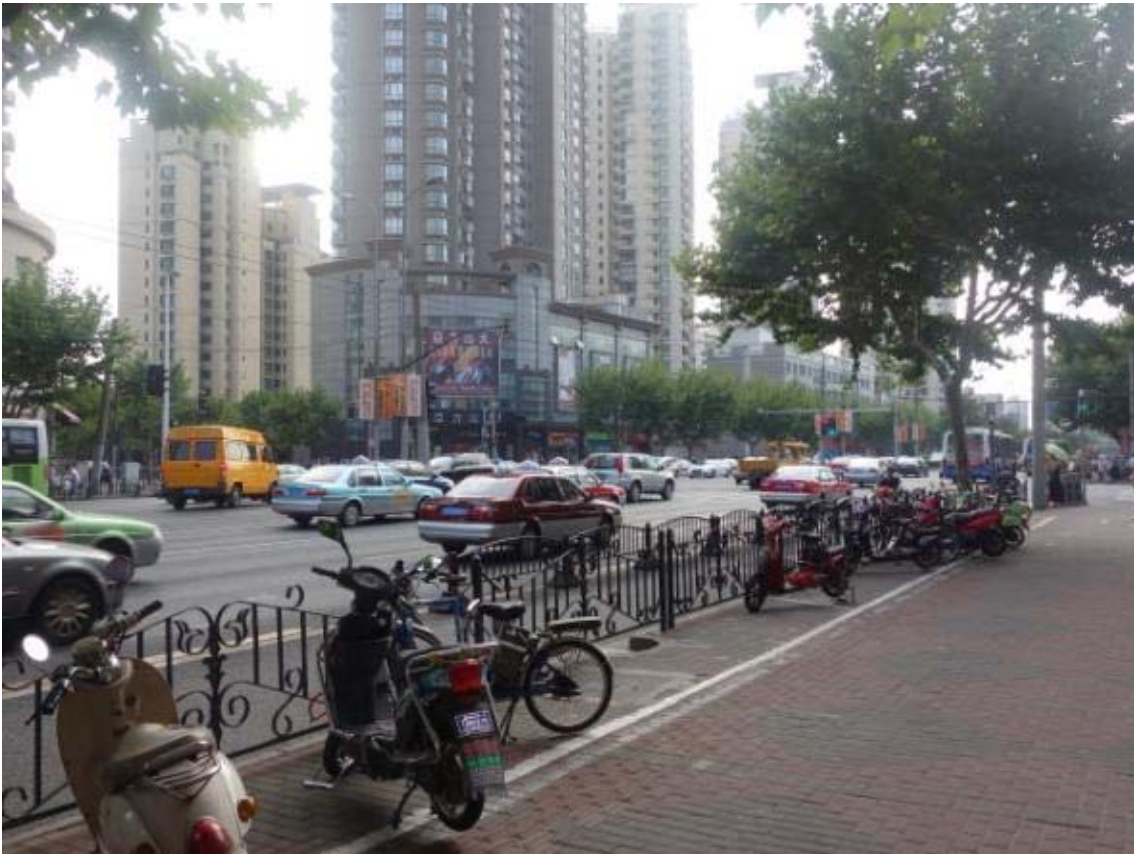
상해 자전거 및 전동차 주차시설 특별히 구조물이 설치되어 있지는 않음