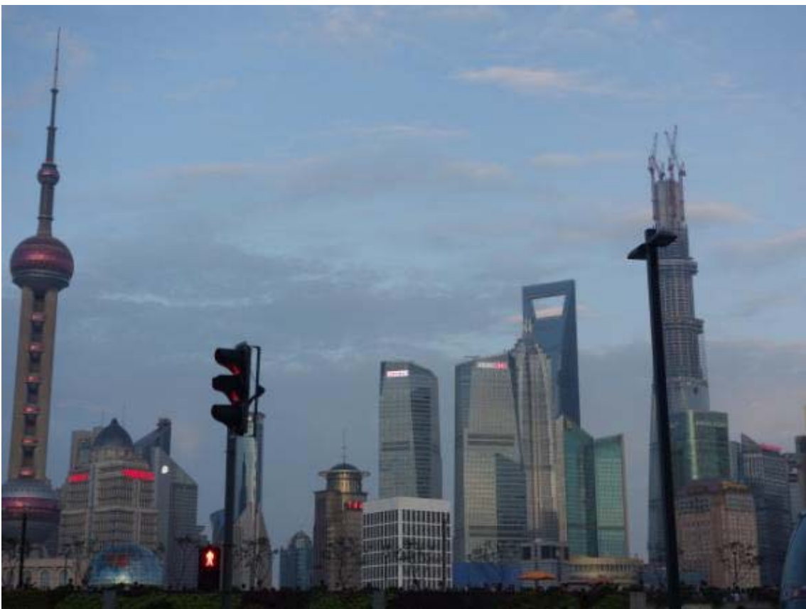
와이탄의 푸서지역에서 바라본 푸둥지역의 고층빌딩들(스케일이 다름)