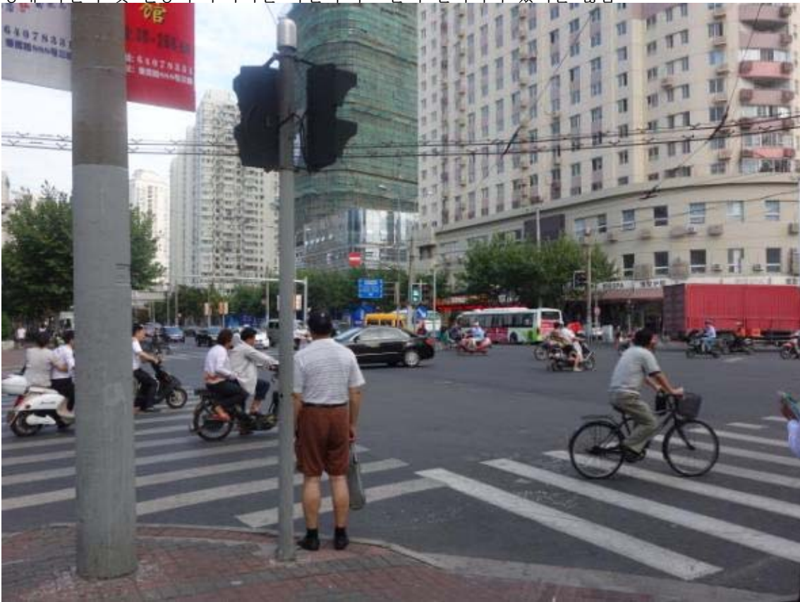
홍차오루 교차로의 모습(신호등의 신호가 한국보다 3배는 길다) 신호를 지키지는 않음