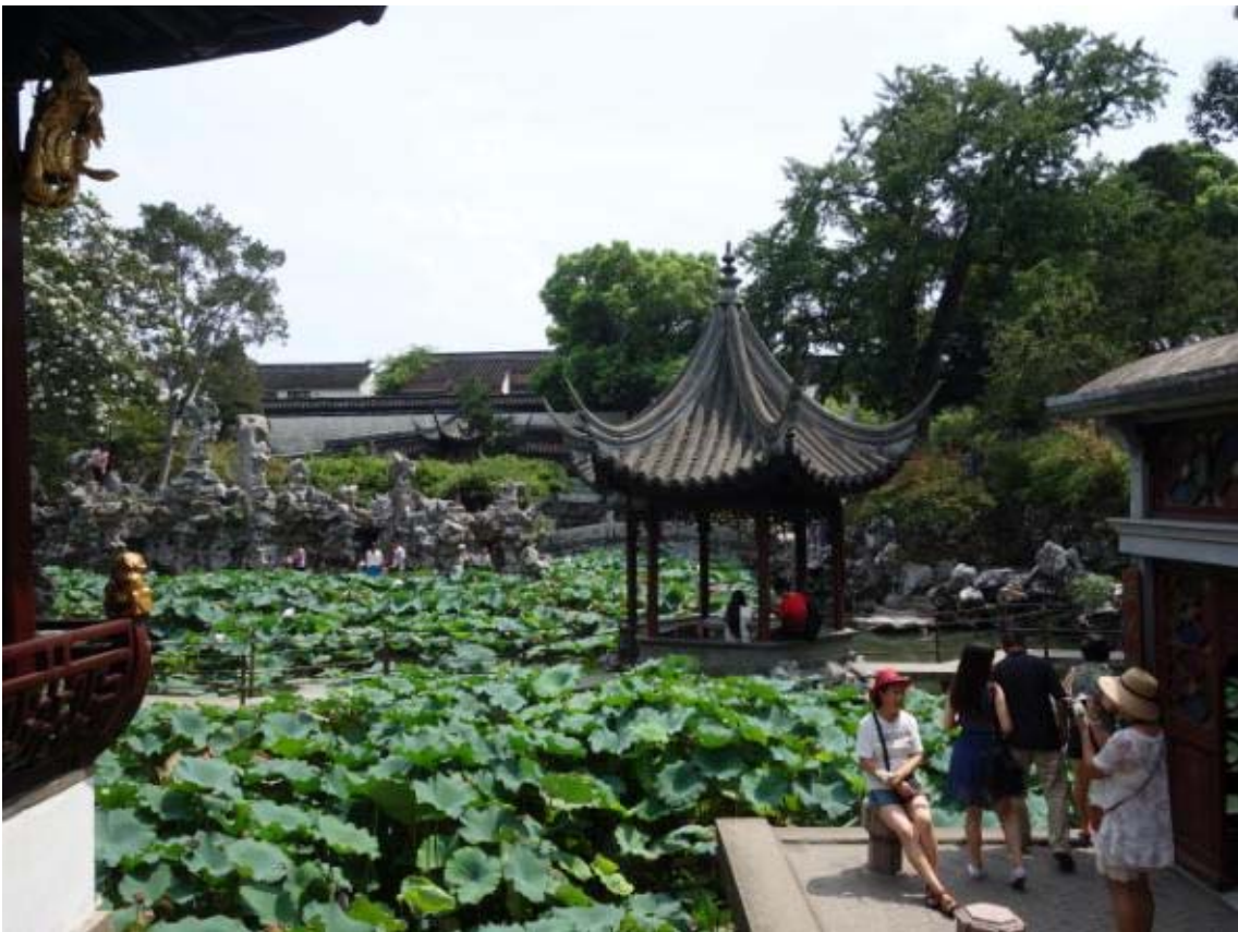
사자림 연밭의 정자