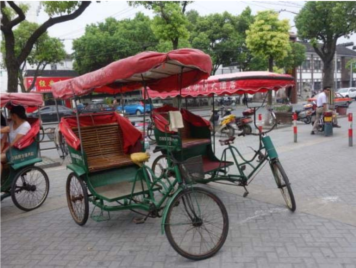
주가의각의 인력 전동차