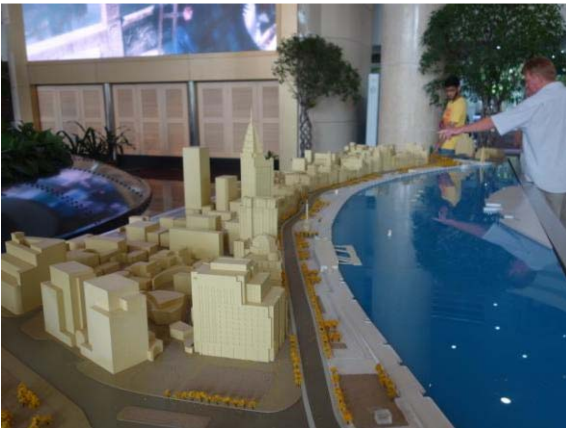
와이탄 거리의 모형