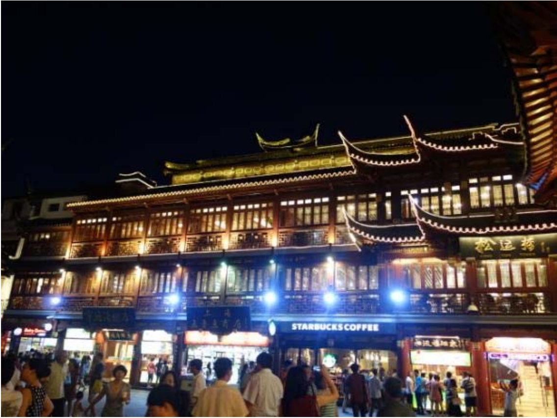
스타벅스는 상해 곳곳에 분포함..