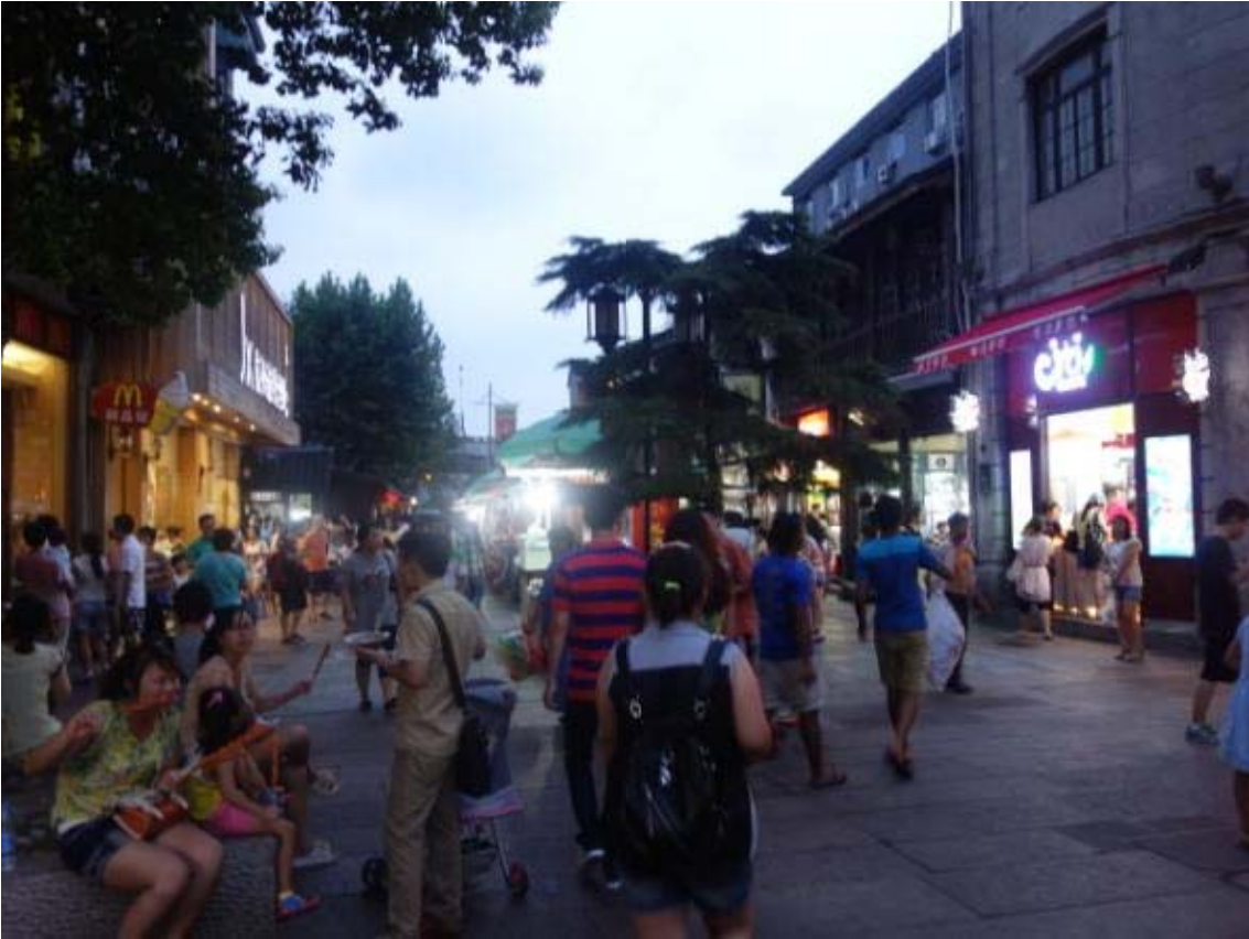
항저우 야시장인 청하방 옛거리(서울의 인사동과 비슷한 거리)