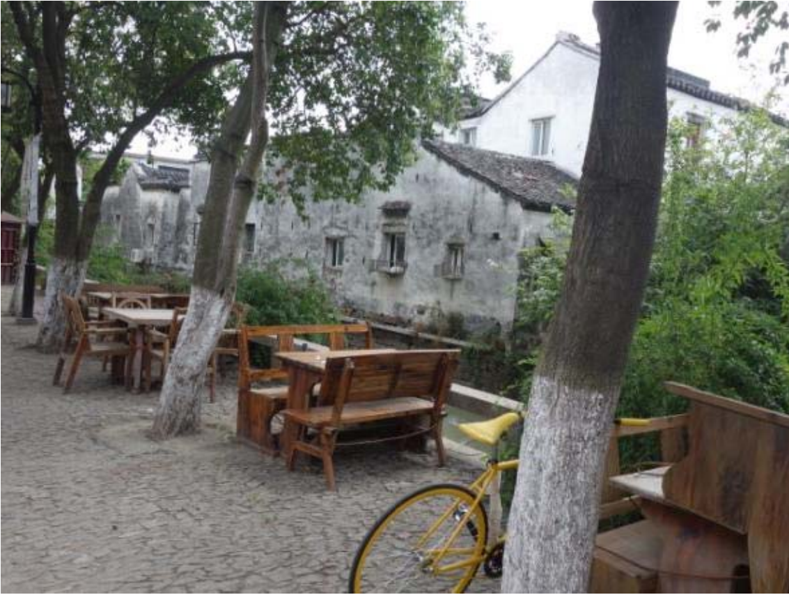
수로 주변 가로에는 카페와 휴식공간이 자리 잡고 있으며, 쾌적한 환경을 제공하고 있음