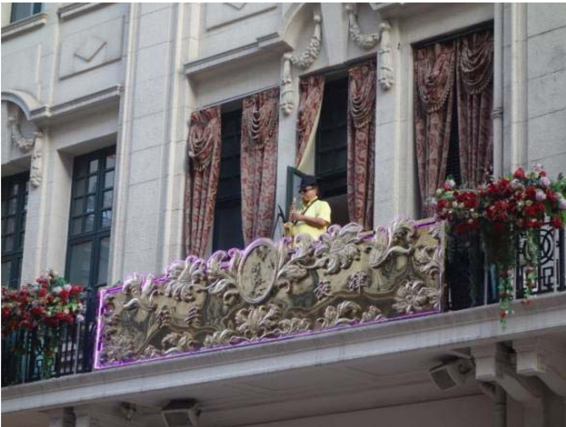
난징동루의 불거리 중 하나인 거리공연으로 다양한 프로그램이 운영됨