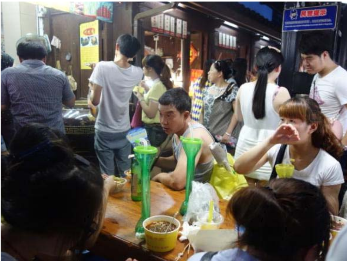
청하방 옛거리의 독특한 장소인 야시장에는 중국 전통음식과 신기한 음식들이 자리잡고 있음.