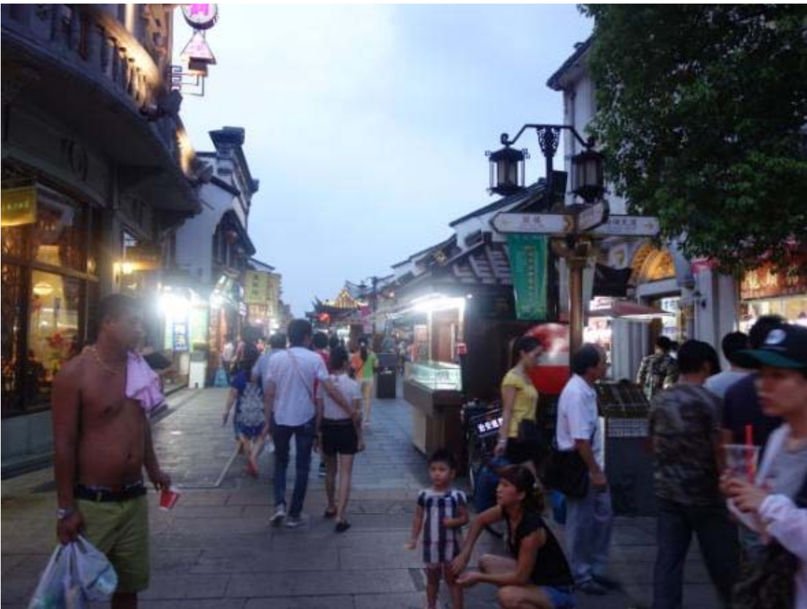
잘 정비된 가로와 노점 가판대로 보행이 편리하며 다양한 볼거리가 있음