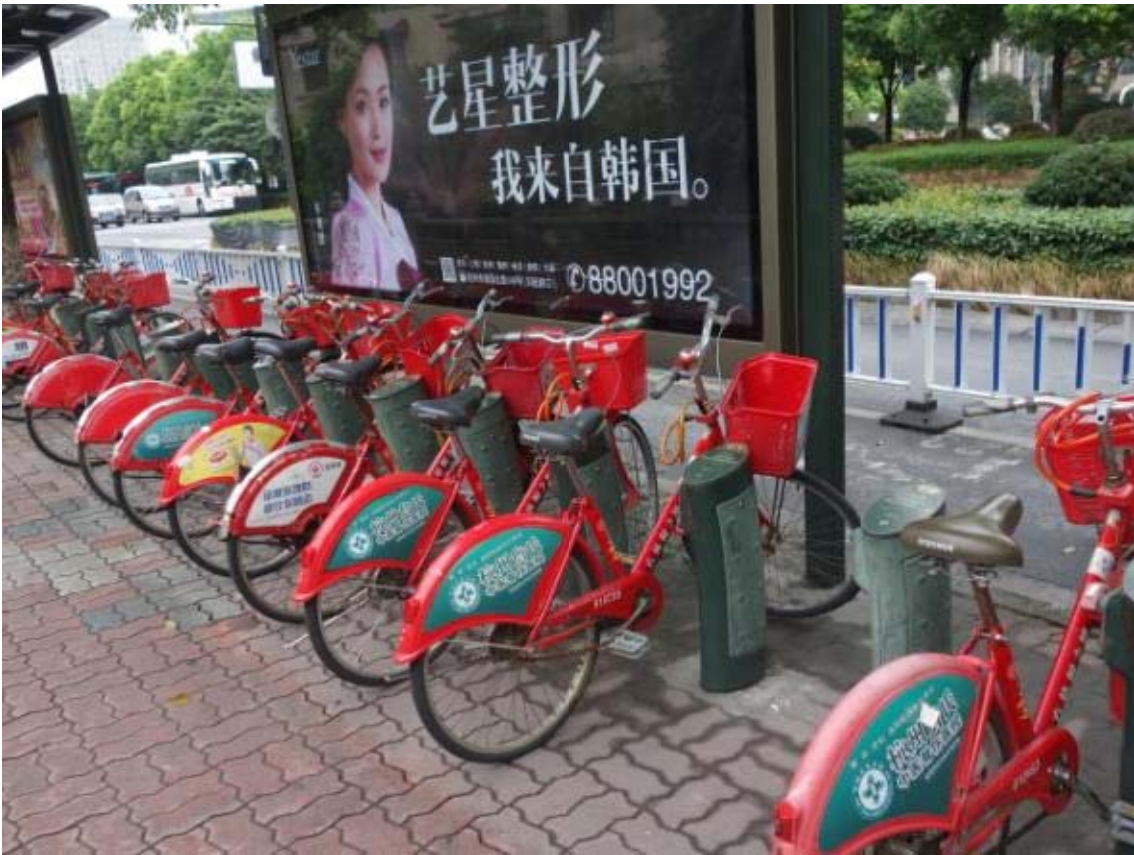
항저우의 자전거 주차시설(체계적으로 되어 있으며 시민들은 카드를 가지고 이용가능)