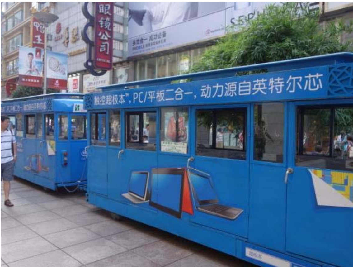
난징동루의 트램(5대정도의 트램이 운행중이며 시속 5km정도로 운행함)