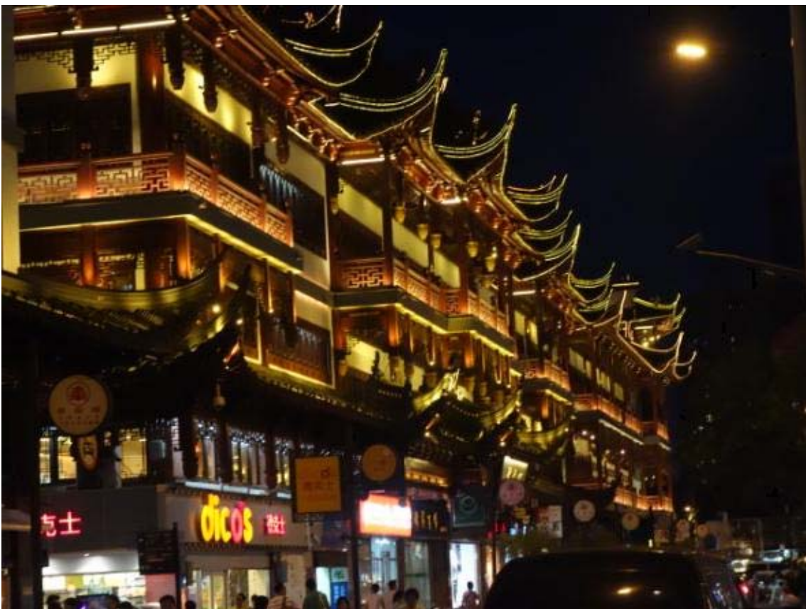
예원의 건축물은 밤이 되면 더욱 화려해 짐