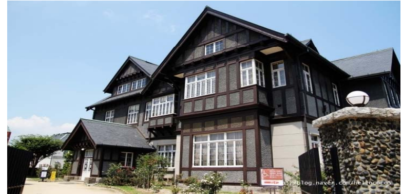
<구 모지미쓰이 클럽>