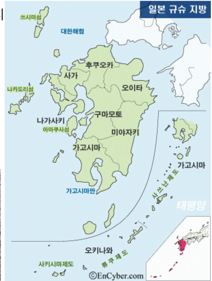
<규슈 지방 전도>