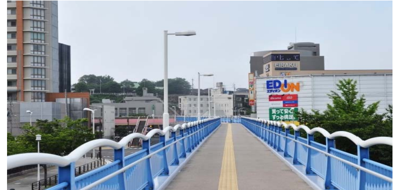
<국제터미널과 이어진 하늘색 육교>